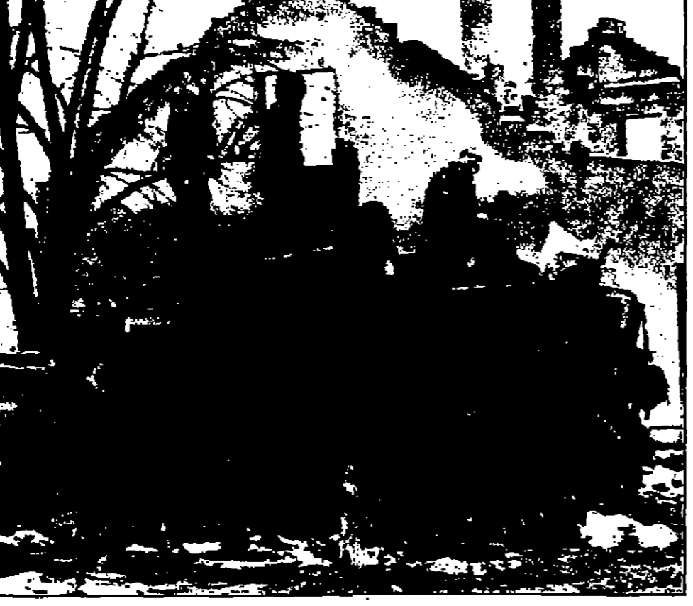
جنود اميركيون على ظهر جبالهم قرب بلدة كرانا جاك في بوسنة.